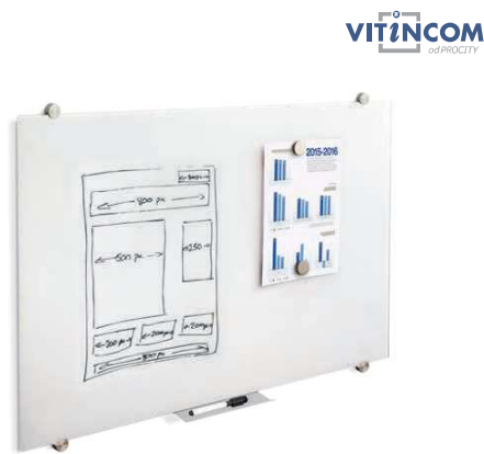
■ Ref. 504652