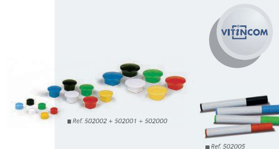
■ Ref. 502002 + 502001 + 502000