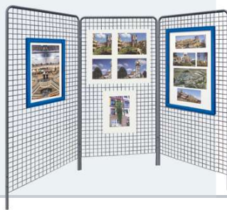
■ Ref. 513603