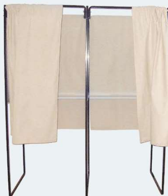
■ Ref. 205101+205111