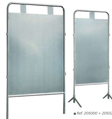
■ Ref. 205010