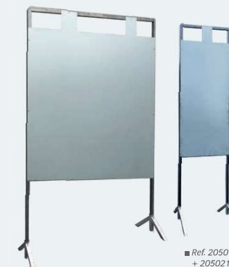
■ Ref. 205013 + 205021