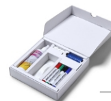
(STARTERKIT) STARTERKIT STARTPACKUNG