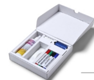
(WBCLEANER) SPRAY CLEANER WHITEBOARDREINIGER