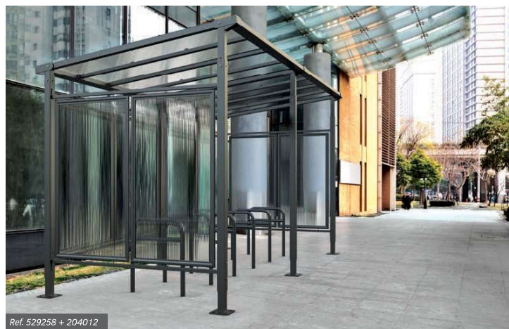
Ref. 529258 + 204012

Dvoubarevné provedení dodává přístřešku unikátní styl a šmrnc.