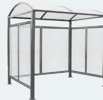
■ Ref. 529050