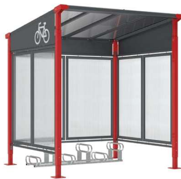
■ Ref. 529257 + 529252 + 529158

Stojany a opěrky na kola: viz strany 62 až 70.