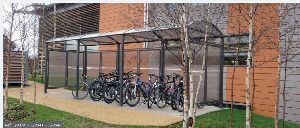
Ref. 529374 + 529041 + 529048