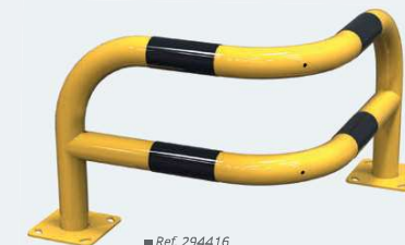
■ Ref. 294416

Usazení: přímým zapuštěním nebo na patky.