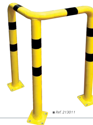
■ Ref. 213011