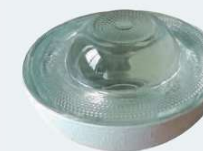
Ref. 120020 ø 100 mm